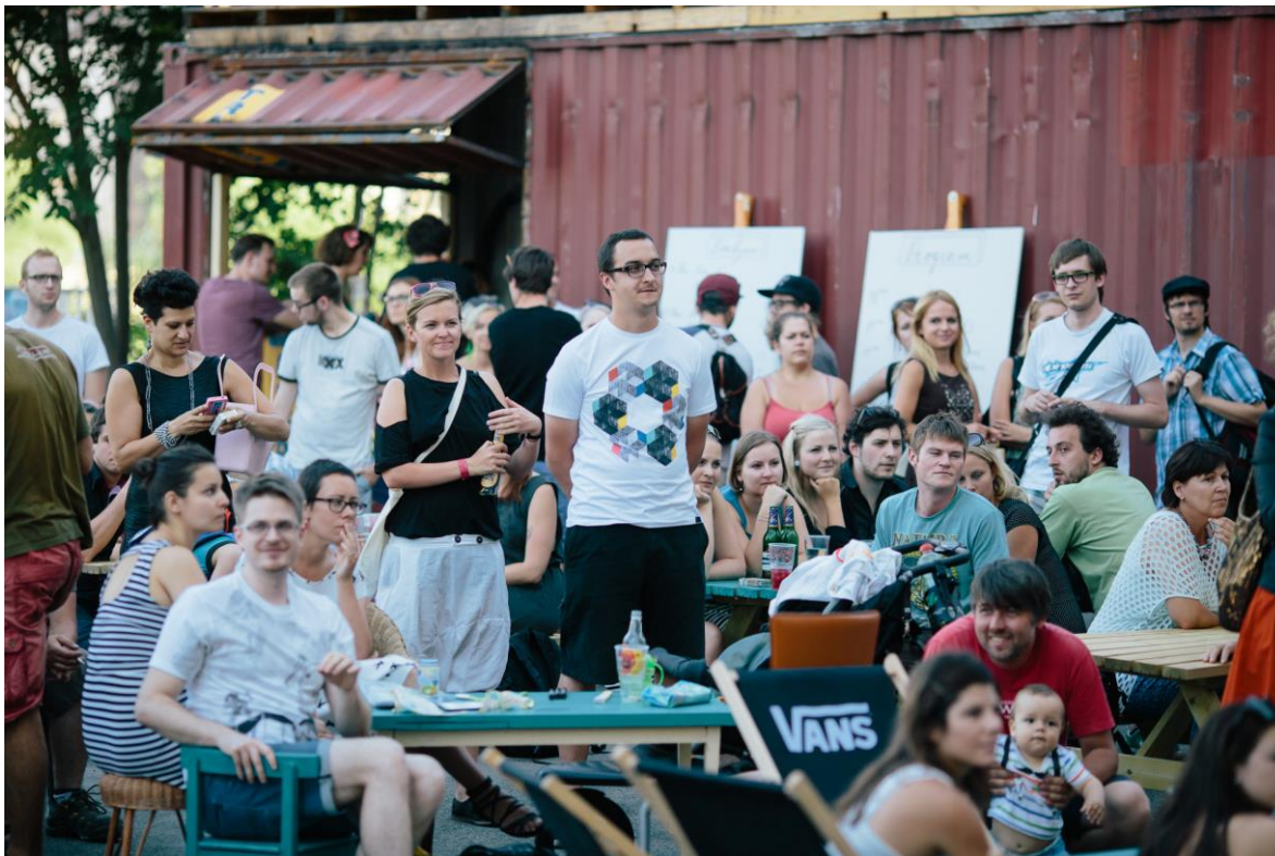
Zahájení sezóny, 23. 7. 2013