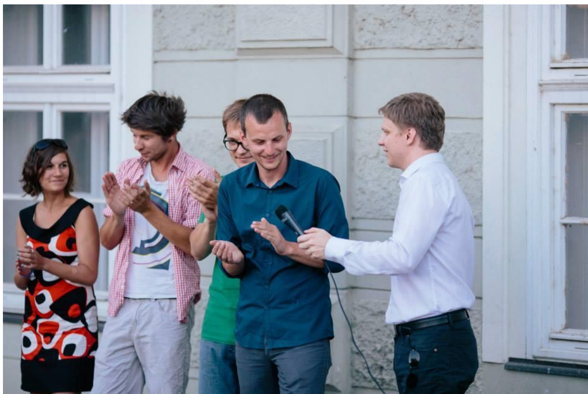
Zahájení 23. 7.